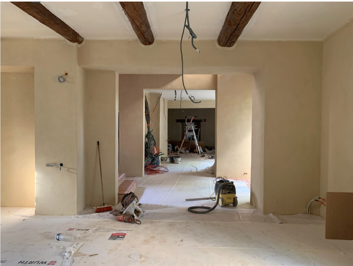
Jas de Bouffan, Aix-en-Provence