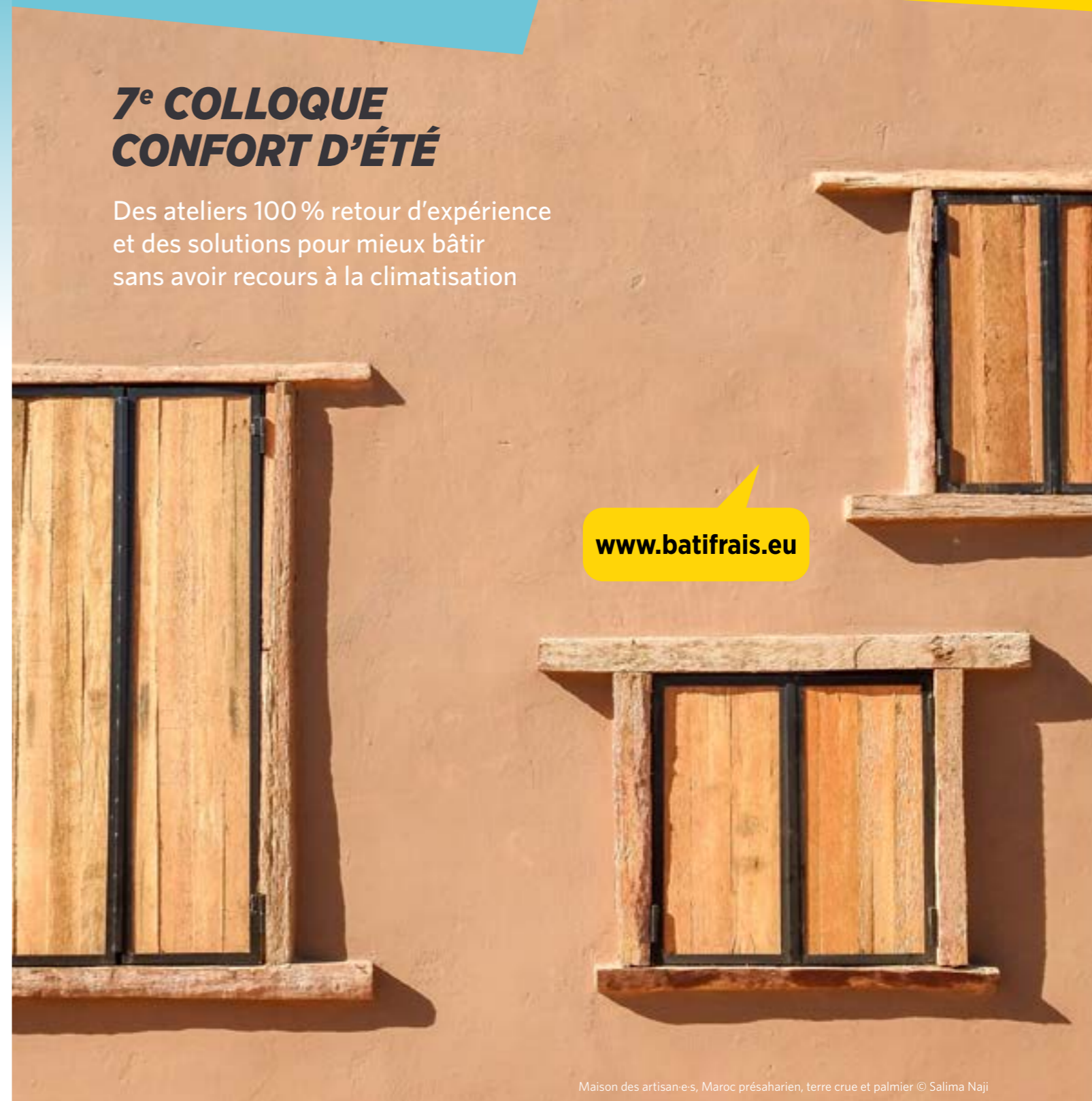
Maison des artisan-e-s, Maroc présaharien, terre crue et palmier © Salima Naji