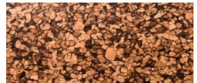
Liège brut en vrac

Les panneaux servent d'isolants pour les murs, toitures et soubassements. Ils sont cloués ou collés sur un support sec et sans fissure afin d'éviter les ponts thermiques. Pour le liège brut, la fabrication de panneaux se fait à l'aide de colle. Cependant, pour le liège expansé, ce n'est pas nécessaire : on obtient déjà un bloc façonnable en panneaux en fin de fabrication.