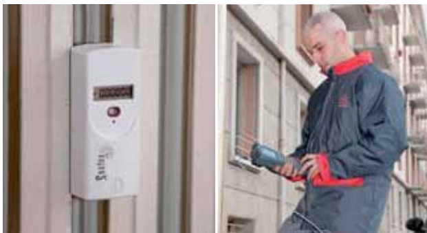
Répartiteur électronique et son relevé depuis l'extérieur.

d'un compteur d'énergie thermique , placé à l'entrée du logement.