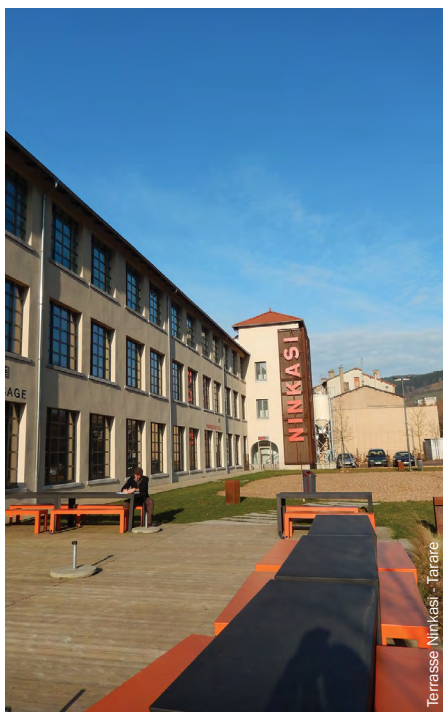
Terrasse Ninkasi - Tarare